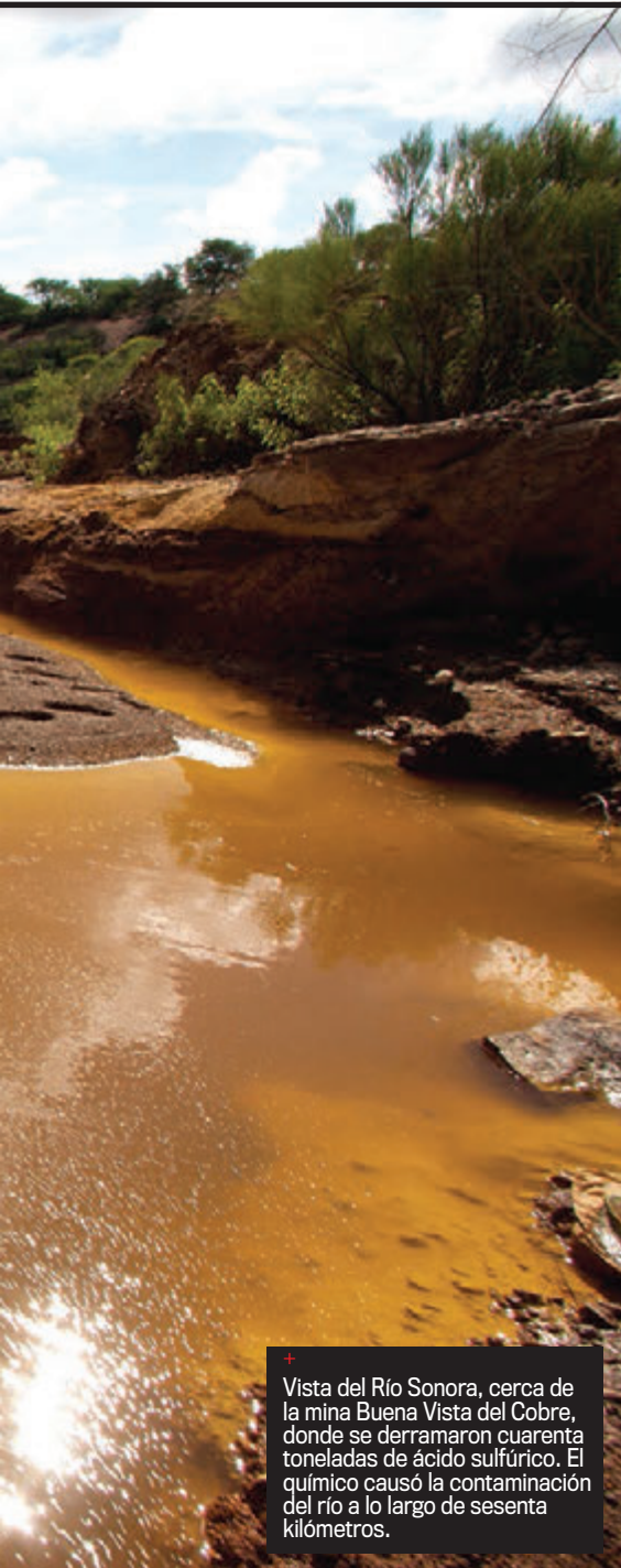
+ Vista del Río Sonora, cerca de la mina Buena Vista del Cobre, donde se derramaron cuarenta toneladas de ácido sulfúrico. El químico causó la contaminación del río a lo largo de sesenta kilómetros.

maron de la piel. Durante meses les llevaron pipas y a algunos les dieron el dinero del fideicomiso. Los ganaderos se lo gastaron en comprar comida para los animales, otros para intentar curar a sus hijos, los más para ir la pasando.