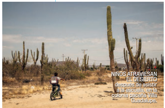
NIÑOS ATRAVIESAN EL DESIERTO después de asistir a la escuela, en la colonia paceña Villa Guadalupe.