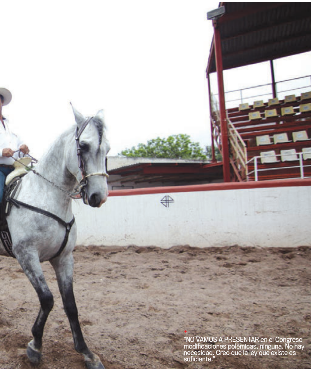
“NO VAMOS A PRESENTAR en el Congreso modificaciones polémicas, ninguna. No hay necesidad. Creo que la ley que existe es suficiente.”

de Administración Pública, total. Con ella vamos a reducir el aparato de gobierno; vamos a establecer las figuras ciudadanas. Listo. Ninguna otra.