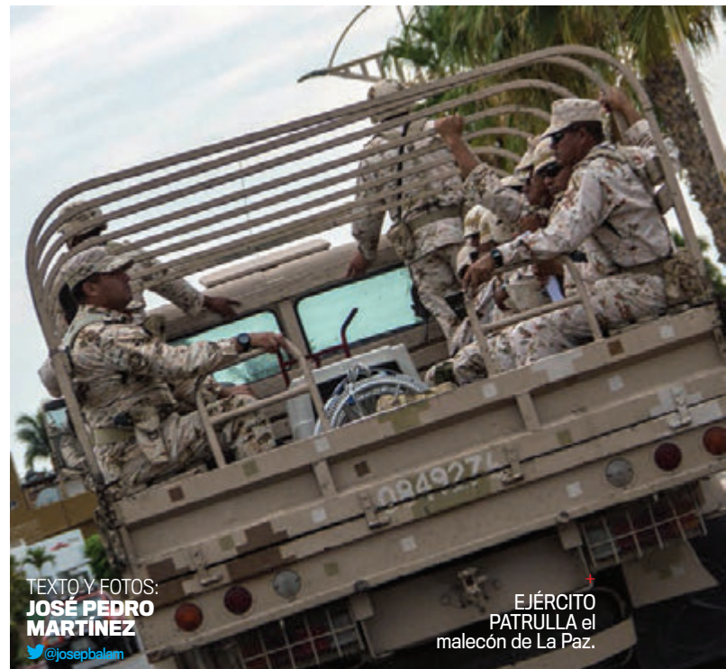
TEXTO Y FOTOS: JOSÉ PEDRO MARTÍNEZ @josepbalam

El PAN arrasó en Baja California Sur en las elecciones del 7 de junio y aseguró la gubernatura, el Congreso y los cinco municipios del estado. Los sudcalifornianos castigaron al PRI por elevar los impuestos, las promesas incumplidas tras la devastación del huracán Odile y la corrupción de las altas esferas partidistas. La administración entrante tendrá que lidiar con el lastre del endeudamiento, el estancamiento de la economía y la inseguridad.