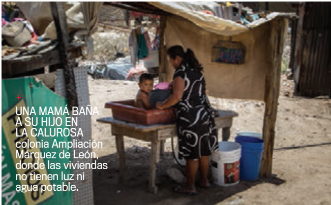
UNA MAMÁ BAÑA A SU HIJO EN LA CALUROSA colonia Ampliación Márquez de León, donde las viviendas no tienen luz ni agua potable.