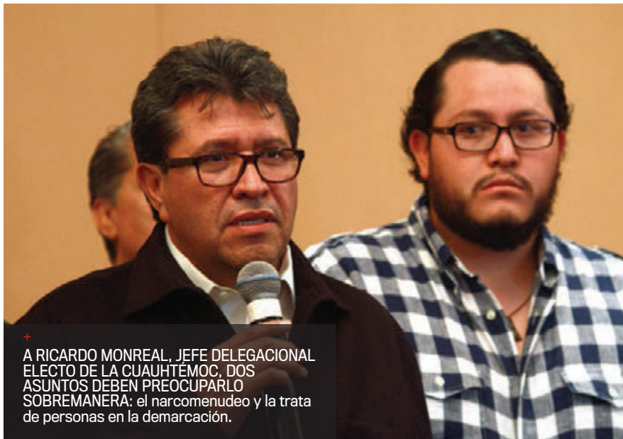
+ A RICARDO MONREAL, JEFE DELEGACIONAL ELECTO DE LA CUAUHTÉMOC, DOS ASUNTOS DEBEN PREOCUPARLO SOBREMNERA: el narcomenudeo y la trata de personas en la demarcación.

los ciudadanos reclaman: recuperación de espacios públicos, calles y banquetas, mejora de servicios básicos, como el de la basura, por ejemplo.