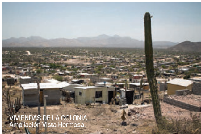
VIVIENDAS DE LA COLONIA Ampliación Vista Hermosa.