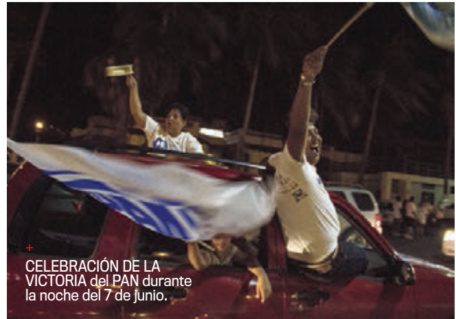
CELEBRACIÓN DE LA VICTORIA del PAN durante la noche del 7 de junio.